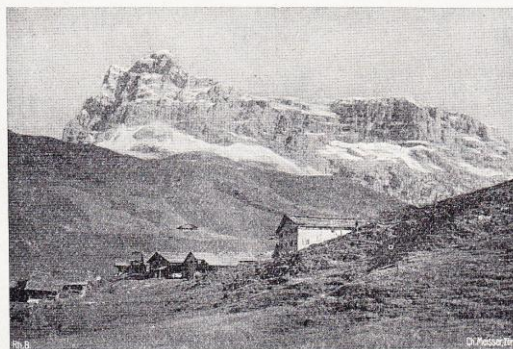
Partnun et la Sulzfluh.

Ce réseau va encore recevoir une extension notable par l'adjonction des deux raccordements dont les travaux ont été commencés en 1909, soit la ligne de la Basse-Engadine, de Bevers à Schuls, après laquelle soupirent depuis longtemps les importantes stations balnéaires et climatiques de la contrée, puis celle d'Ilanz à Disentis, le centre du trafic de la vallée du Rhin antérieur. Ces deux lignes n'ont pas seulement de l'importance en ce qui concerne le trafic des vallées qu'elles desserviront, mais par le fait qu'elles traversent des contrées pittoresques et intéressantes à un haut degré, elles ne le céderont en rien au restant