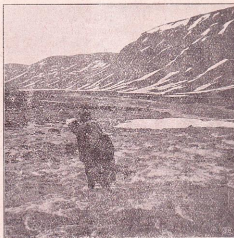
Une rivière dans les Alpes scandinaves.